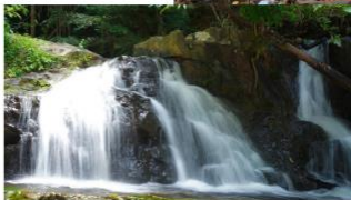
รูปที่ 3 เส้นทาง ป่า อำเภอ นาทวี กิจกรรมท่องเที่ยวเชิงธรรมชาติ การเดินป่าศึกษาธรรมชาติ